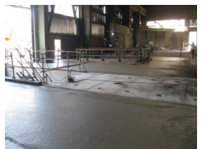
Fosse coulée métal